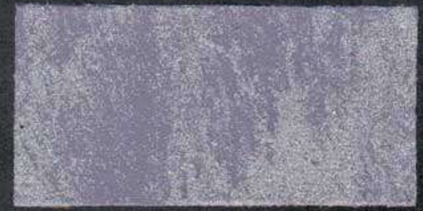
DARK8 Sous-couche NH 10 RV 20 BE 5