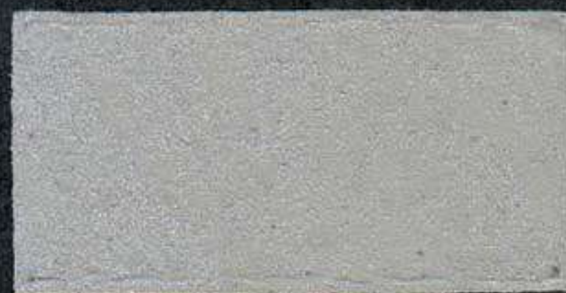
DARK9 Sous-couche JV 15 NH 5 VI 5