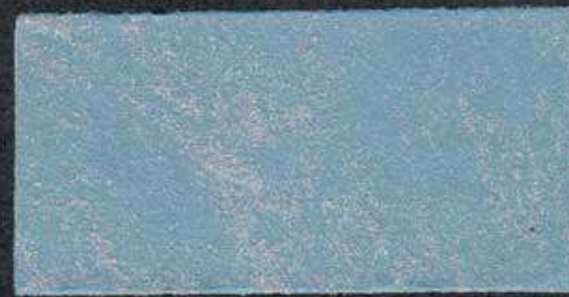
DARK10 Sous-couche BE 5 NH 10