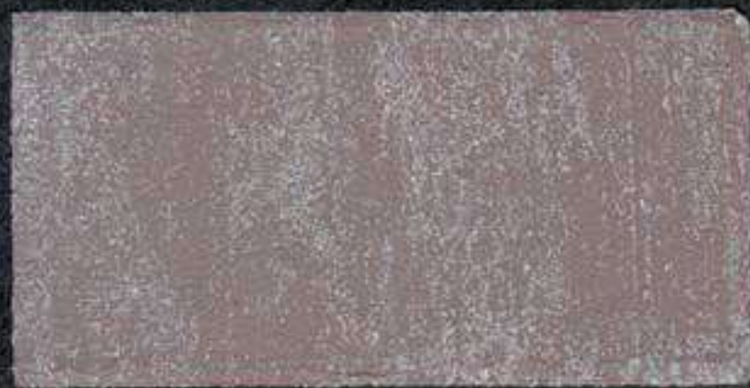
DARK6 Sous-couche JV 20 OV 20 NH 15