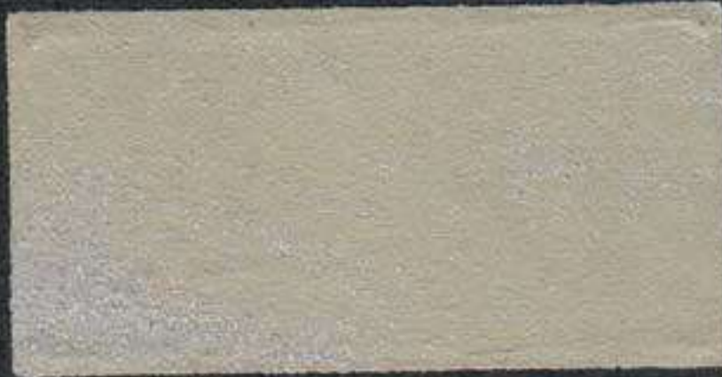
DARK4 JH 20 NH 5 PV 5