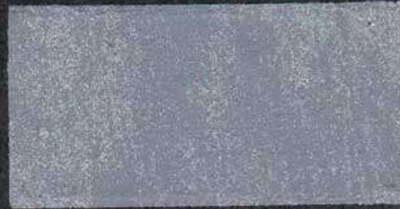
DARK7 NH 20