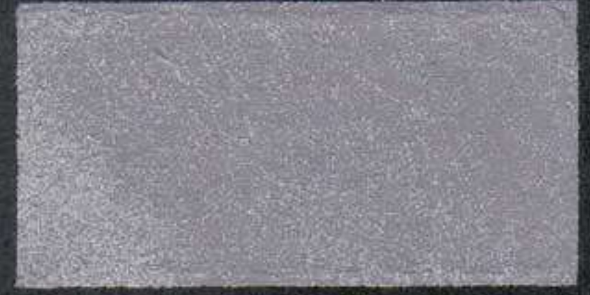
DARK5 Sous-couche NH 15 OV 5