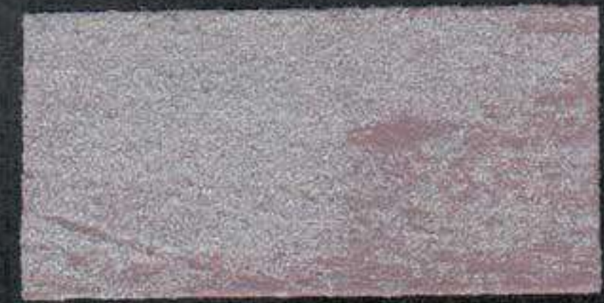
DARK11 Sous-couche JV 20 OV 20 NH 10