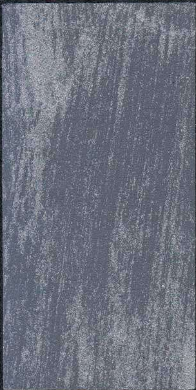
DARK1 Sous-couche NH 40 ML