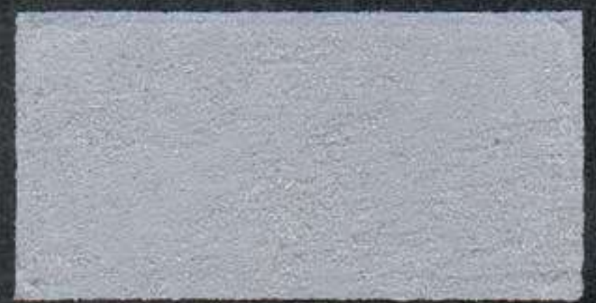
DARK3 Sous-couche NH 5