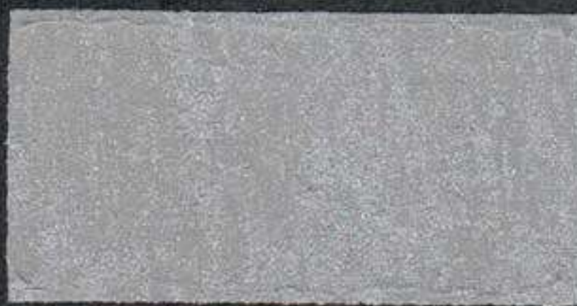
DARK2 Sous-couche JH 15 NH 10